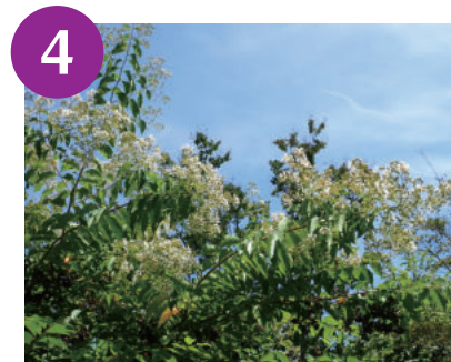
シマサルスベリ (～9月)