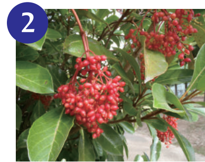
サンゴジュの果実 (～9月)