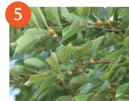
エノキの果実 (～下旬)