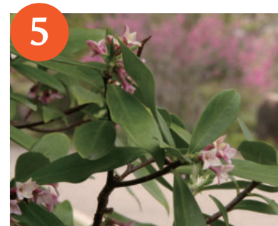
5 ジンチョウゲ (3月中旬～)