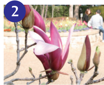
2 シモクレン (3月中旬～)