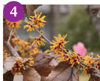
4 シナマンサク (～3月中旬)