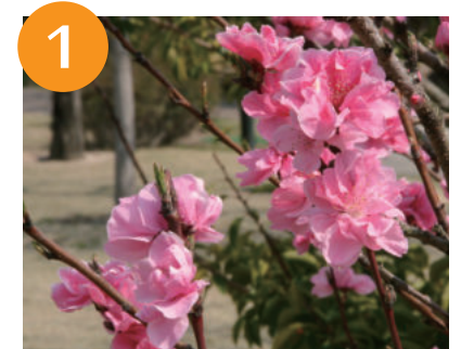
1 ハナモモ (3月中旬～)