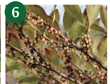
6 ヒサカキ (3月中旬)