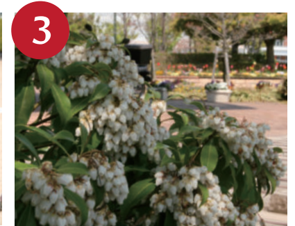
3 アセビ (3月中旬～)